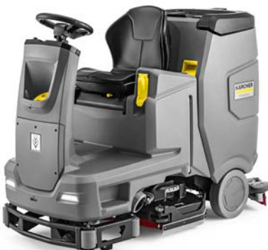
B 110 R BP PACK

Die ideale Wahl zur Reinigung großer, wenig überstellter Flächen (2.000 bis 10.500 qm).