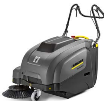
KM 75/40 W BP PACK