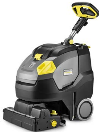
BR 45/22 C BP PACK