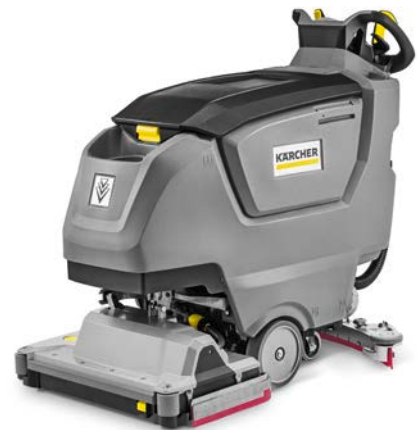
BR 50 W BP PACK