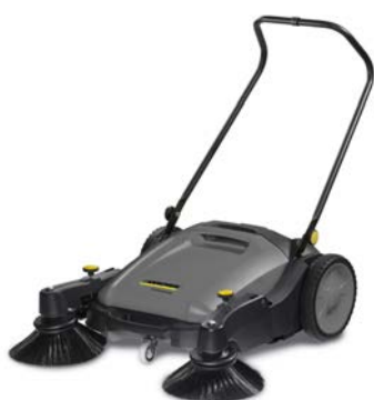
KM 70/20 C 2SB

Für Höfe, Wege, Werkstätten und Hallen - ergonomisch und leicht bedienbar (ab 300 qm).