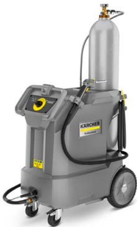
IB 10/8 L2P

Die Trockeneisreinigung verbindet eine starke Reinigungsleistung mit maximaler Schonung der Oberflächen. Mit Trockeneis können Sie sehr viele Materialien wie Metalle, Kunststoffe, Holz, Glas oder Textilien makellos bis in die Tiefe reinigen.