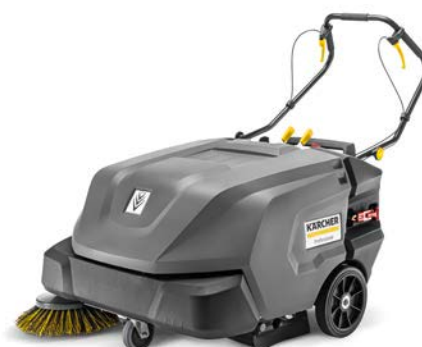
KM 85/50 W BP PACK