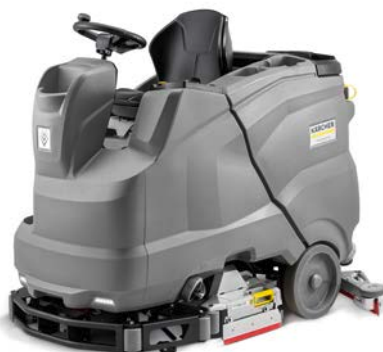
B 150 R BP PACK