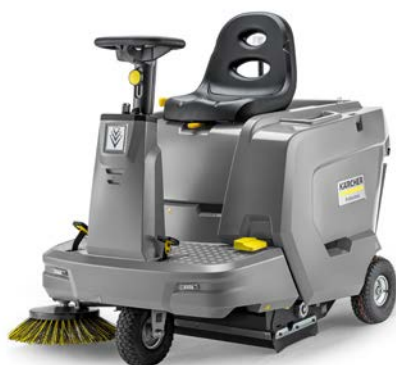
KM 85/50 R BP PACK

Wirtschaftlich, sauber und effizient auf mittleren und großen Flächen (bis 6.000 qm).