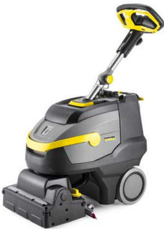
BR 35/12 C BP PACK

Zur schnellen und flexiblen Reinigung kleiner bis mittelgroßer Flächen (bis zu 2.000 qm).