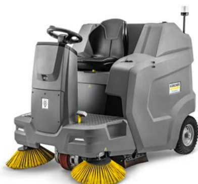
KM 100/120 R BP PACK