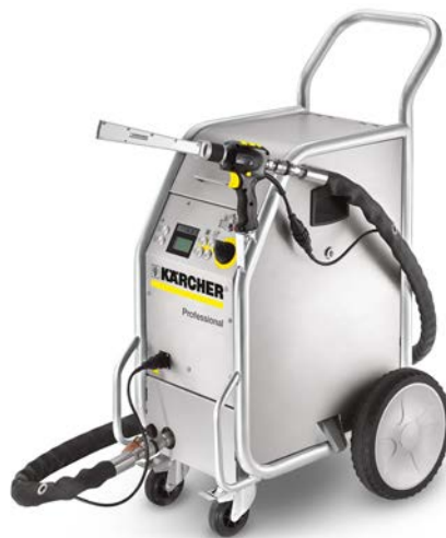
IB 7/40 ADV