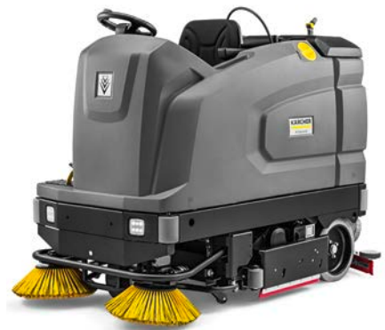
B 260 RI BP PACK