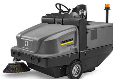
KM 120/250 R BP PACK